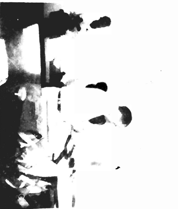
wax ka faa'iidaydano si aan u helo inaan waxna diidno waxna oggolaano".